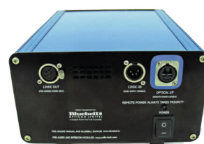
Remote End Rear