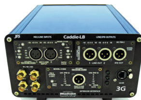
Remote End Front