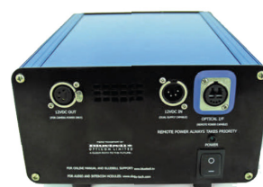
Control End Rear