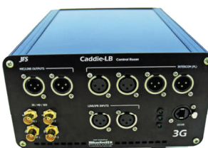
Control End Front