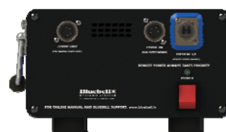
Control End Rear