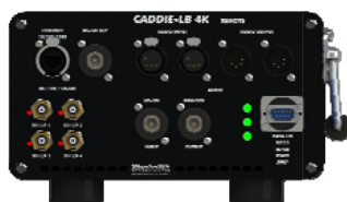
Remote End Front