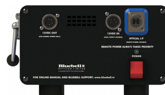
Remote End Rear