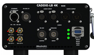
Control End Front